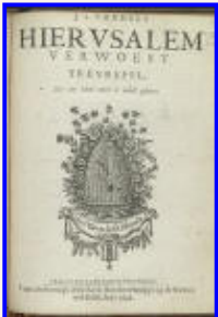
"Jerusalem laid desolate" Hierusalem Verwoest