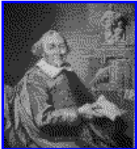
JOOST VAN DEN VONDEL (1587-1679)